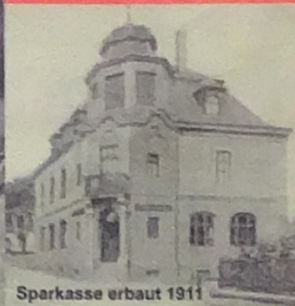
Sparkasse erbaut 1911